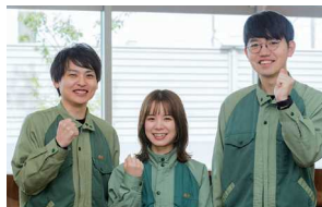
「維新の会」メンバーの皆さん

このプログラムは「地域に愛される工場に」との思いを胸に、工場に勤務する有志で結成された「維新の会」が中心となって企画しました。専用車に乗り、俳優