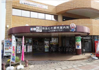
大牟田駅東口を出てすぐの建物。ジャー坊の看板が目印です。