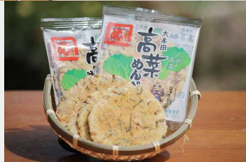
大牟田限定販売の「高菜めんべい」。三池高菜を生地に練り込み、ピリリと辛い味付けはおつまみにもピッタリ。

隣町の南関町（熊本県）との県境近くにある、ガラス張りが特徴的な道の駅。館内には、採れたての地元野菜と花、大牟田の特産品をはじめとする多彩な商品が勢揃い。イートインスペースもあり、購入した商品をお店で味わえるので、お帰りの前に少しくつろいでみては。