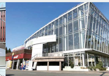
ガラス張りが目を引く建物は、太陽光を取り込み、館内はとても明るい。