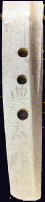
▲▶ 脇差 銘 典太作 (室町時代 前期)

期間 令和六年十二月十七日(火)～令和七年二月二日(日) 会場 カルタックスおおむた (福岡県大牟田市宝坂町2丁目2-3)