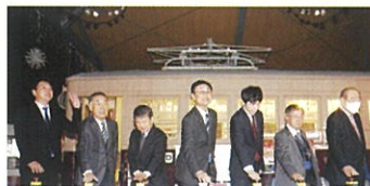
大牟田駅西口点灯式 (2023.12/3)

大牟田市役所 12/ 6(金) 18:00 三川坑 11/23(祝) 18:00